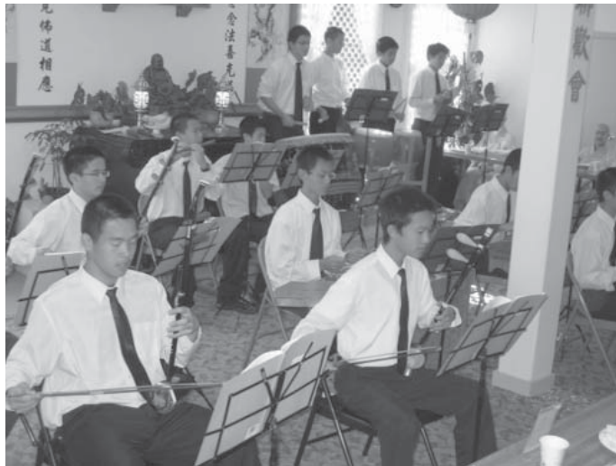
Học sinh trường Trung Học Bồi Đức, Vạn Phật Thành, nhân Lễ Kính Lão tại Gold Mountain Monastery.