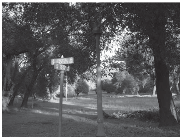
Đường Chánh Niệm & Đường Chánh Mạng tại Vạn Phật Thành

Người tu đạo nên vì chúng sanh làm phước điền tăng, thay chúng sanh gieo phước, tiếp nhận sự cúng dường, và không được phan duyên, cũng như không được tham cầu sự cúng dường. Người tu hành chỉ nên tùy duyên, tùy phương tiện chứ không có ý đồ gì khác. Tại sao người xuất gia không thành đạo? Bởi họ không phá nổi hai cửa tài, sắc. Tài khiến người mê hoặc, sắc làm cho người điên đảo. Hai tảng đá chướng ngại này cản trở người tu hành, khiến người ta đắm mê không cách gì tự thoát ra được, thậm chí lại còn trôi nổi hòa theo.