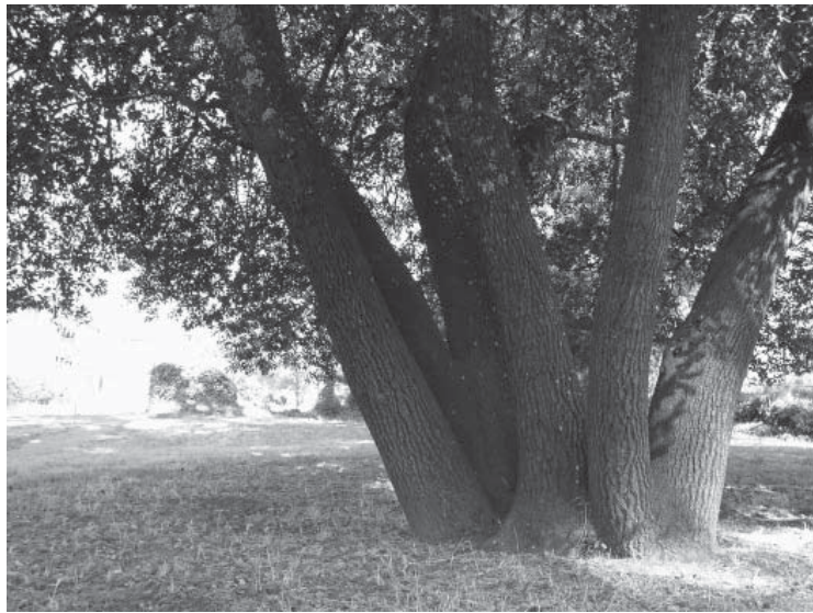
Cây cổ thụ ở Vạn Phật Thành