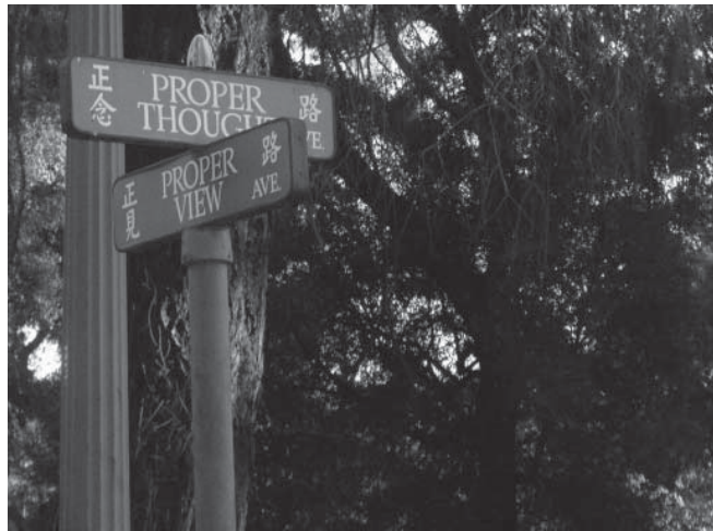
Đường Chánh Niệm & Chánh Kiến tại Vạn Phật Thành