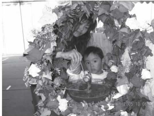
Hai mẹ con đang tắm Phật, Vạn Phật Thành