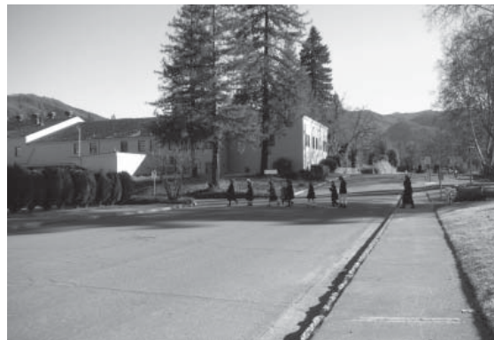
Các em học sinh tiểu học trên đường tới chánh điện tham gia khóa cúng nọ.

Đức Khổng Tử nói: “Thiên mạng gọi là Tánh, tuân theo Tánh gọi là Đạo, tu Đạo là vì Giáo và không thể xa rời, dù trong tích tắc.” Nếu đạo có thể xa rời thì không phải là Đạo. Theo khuynh hướng của thời đại hiện nay, chúng ta có thể sửa lại như thế này: “Thiên mạng gọi là Tiền, tuân theo Tiền gọi là Đạo, tu Đạo là vì Tiền. Tiền thì không thể xa rời, dù trong tích tắc.” Cho nên “mở rộng cửa sau, nhưng đóng kín cửa trước” là thế đấy.