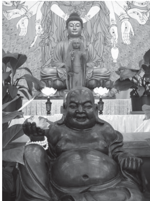
Trai đường, Vạn Phật Thành

Bởi Ngài già rồi, thành thử Ngài ngồi mà không động đây. Mãi cho đến nay, tổ sư Ca Diếp vẫn còn nhập định tại núi Kê Túc ở Vân Nam, chứ Ngài không có nhập Niết Bàn. Tổ chờ Phật Di Lặc giáng thế đây. Rồi phụng mạng lời di chúc của đức Phật Thích Ca, Tổ sẽ đem y cà sa truyền trao lại cho đức Phật Di Lặc, là vị Phật thứ năm của thời Hiền Kiếp. Khi hoàn thành sứ mạng, Tổ mới nhập Niết Bàn.