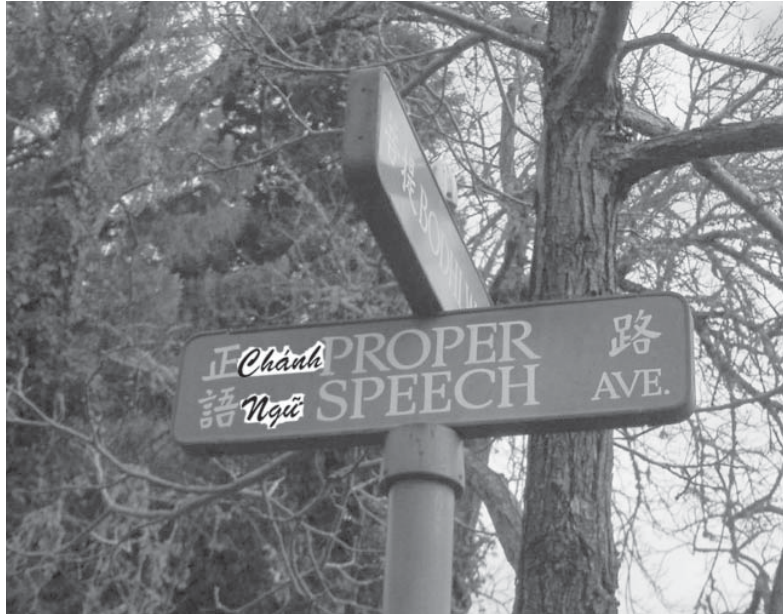
Đường Chánh Ngữ tại Vạn Phật Thành