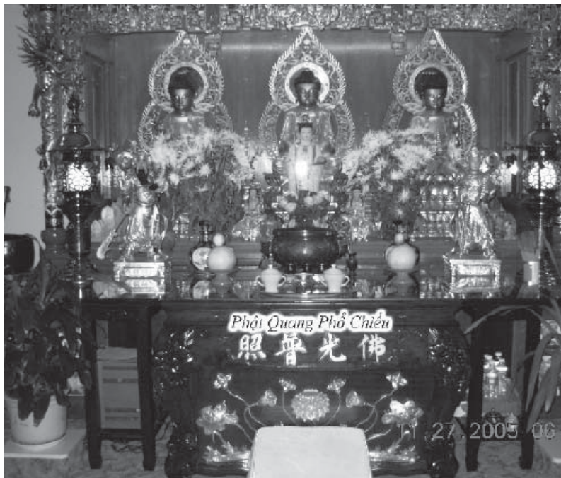
Chùa Kim Sơn, Gold Mountain Monastery