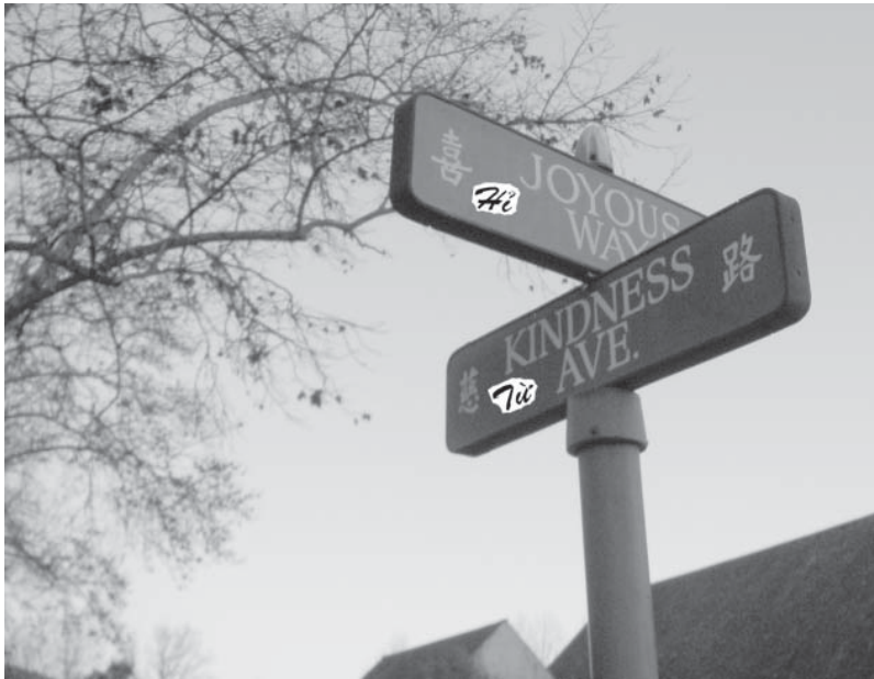
Đường Từ & Đường Hỉ tại Vạn Phật Thành