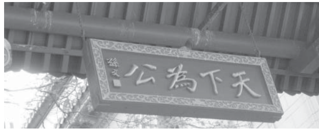
Thiên Hạ Vi Công, cổng China town, San Francisco