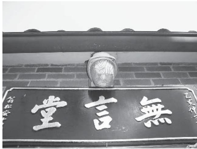
Vô Ngôn Đường, Vạn Phật Thành