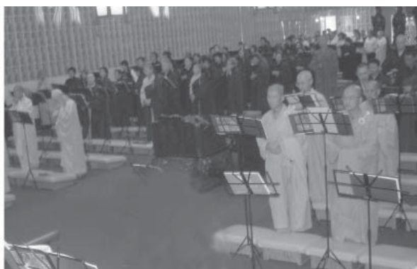
Khóa Lễ Vạn Phật Bảo Sám, Vạn Phật Thành - 05/2007

Vạn Phật Thánh Thành là nơi của vạn Phật hội tập lại. Cho nên mỗi năm vào mùa xuân, chúng ta cử hành đại pháp hội, với ba mươi ngày lễ bái Vạn Phật Bảo Sám, chuyên cầu nguyện cho thế giới hòa bình. Công đức lễ bái sám hối thì không thể nghĩ bàn, vì nó có thể tiêu tai tăng thọ và diệt tội tăng phước.