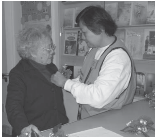
Lễ Kính Lão, Gold Mountain Monastery

4- Không tự tư, ích kỷ: Bất cứ vật gì thuộc về công cộng để mọi người thuận tiện dùng, chúng ta không được cất dấu cho riêng mình. Quý vị có thể bố thí, tức là quý vị không có lòng tự tư, ích kỷ, gọi là: “Xem tất cả người già như cha mẹ ta, thương tất cả trẻ thơ như thương con em mình.” Đó là sự biểu hiện của người không có lòng tự tư ích kỷ. Sự thành lập các trường đại học, trung học, tiểu học và viện dưỡng lão tại Vạn Phật Thánh Thành vốn cũng từ tư tưởng đó.