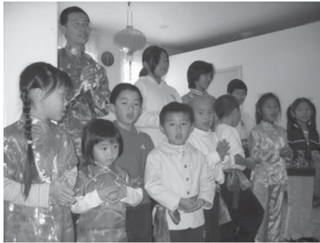
Các em học sinh tại Gold Mountain Monastery