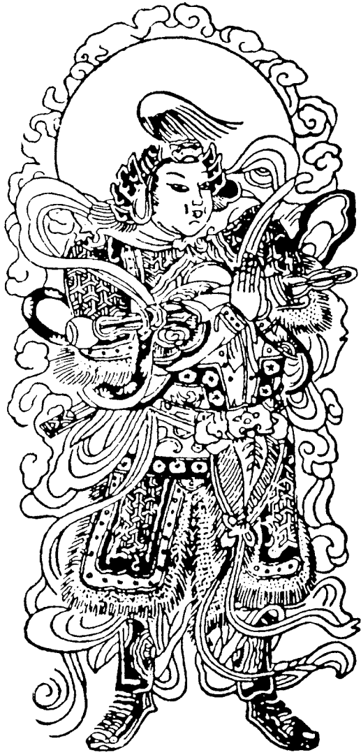
ĐỨC HỘ PHÁP