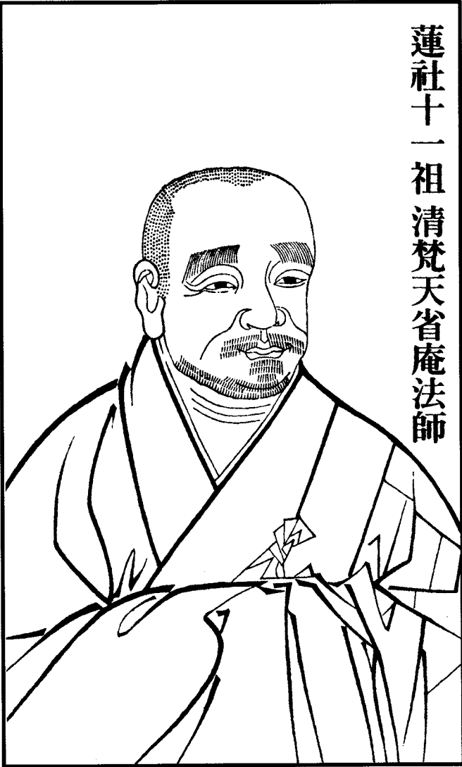
Pháp Sư Tĩnh Am - Vị Tổ thứ mười một của Tông Liên Xã