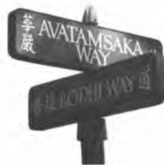
Bảng tên đường Hoa Nghiêm và đường Bồ Đề tại Vạn Phật Thánh Thành