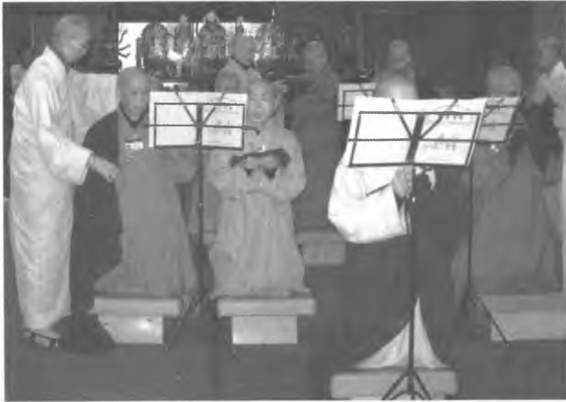
Lễ Xuất Gia tại Pháp Giới Thánh Thành (chi nhánh Vạn Phật Thánh Thành)