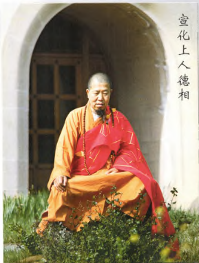
Hòa Thượng Tuyên Hóa