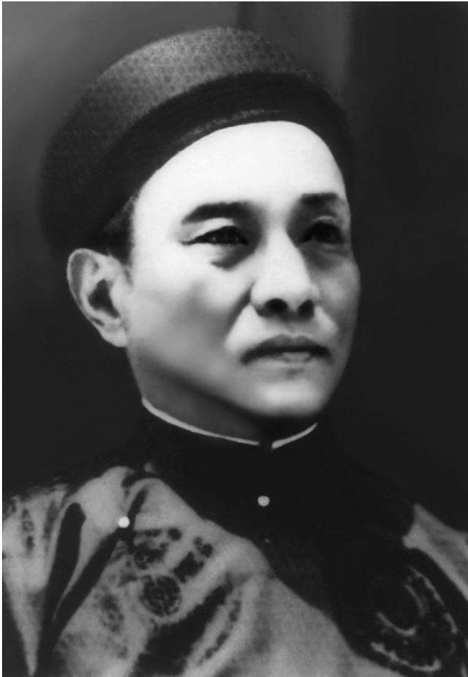
CHÁNH TRÍ MAI THỌ TRUYỀN (1905-1973)