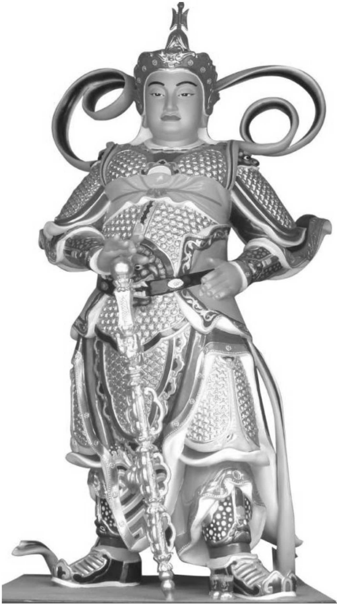
Nam Mô Tỳ Bà Phụ Chánh Hộ Pháp Vi Đà Tôn Thiên Bồ Tát Ma Ha Tát